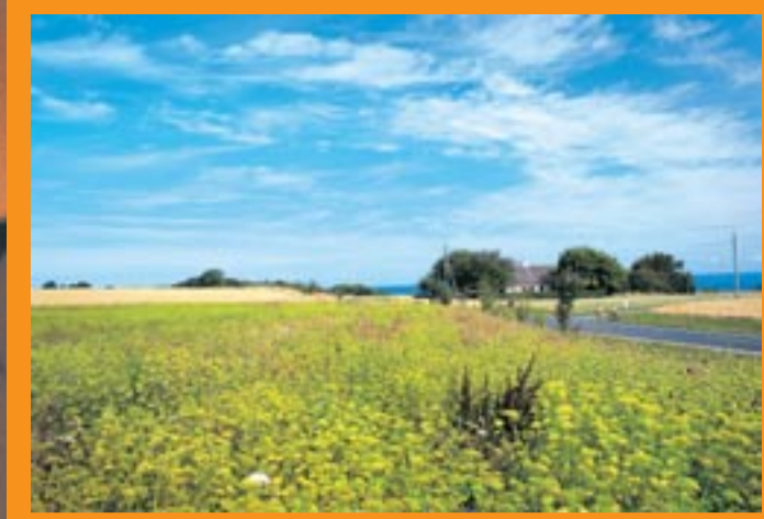
Het eiland Bornholm in de Baltische Zee, waar het heerlijk fietsen is.

DIT MOET JE WETEN OVER DENEMARKEN HOE ERHEEN: rechtstreeks Brussel-Kopenhagen met SAS (tel. 02/643.69.00), SN (tel. 070/35.11.11), Virgin (tel. 070/35.36.37), Maersk Air (tel. 02/712.64.30). MOOISTE PERIODE: de lange lichte zomer, de warmstemmige maand december ETEN EN DRINKEN: een glasje aquavit en dan wat plakjes gerookte zalm. FAVORIET RESTAURANT: Cap Horn, Nyhavn 21, in Kopenhagen, biologisch, gezellig, betaalbaar. OVERNACHTEN: www.cab-inn.dk (goed en goedkoop) of www.danhostel.dk (100 hoogwaardige jeugdherbergen) WAAR WORD JE STIL VAN: uitkijken over het water vanuit de tuin van het museum voor moderne kunst Louisiana in Humlebæk. MOOISTE GEBOUW: De Ronde Toren met zijn spiraalring en uitzicht. WELKE PLAATS MIJDEEN: als voertuiger het fietspad, want de vele tweewielers komen héél snel. WAARAAN ERGER JE JE: de vroege winkelsluiting op zaterdagmiddag. INFO: toerisme-cel bij de Deense Ambassade, Aarlenstraat 73, 1040 Brussel. Tel. 02/233.09.23. Voertalen telefoon Frans of Engels, materiaal in het Nederlands. Websites: www.visitdenmark.com (alles over het land in het Nederlands) - www.hca2005.com (alles over de Andersenviering) - www.wocw.dk (Kopenhagen en omgeving). LEZEN: Nu en altijd Hans Christian Andersen, vertaald Peter Heeg of Karen Blixen.