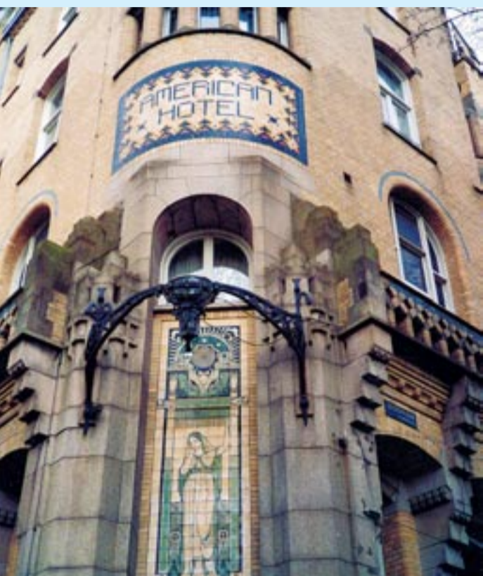
Een fantasierijke gevel in art nouveau maakt van hotel American iets bijzonders.

Wie een citytrip in Amsterdam in stijl wil beleven, moet een kamer boeken in hotel American, voluit Crowne Plaza Amsterdam-American (****), aan het Leidseplein. Met zijn klokrentoren en zijn fantasierijk metselwerk in art nouveau-stijl springt het gebouw meteen in het oog als je van de Stadhouderskade over de brug komt.