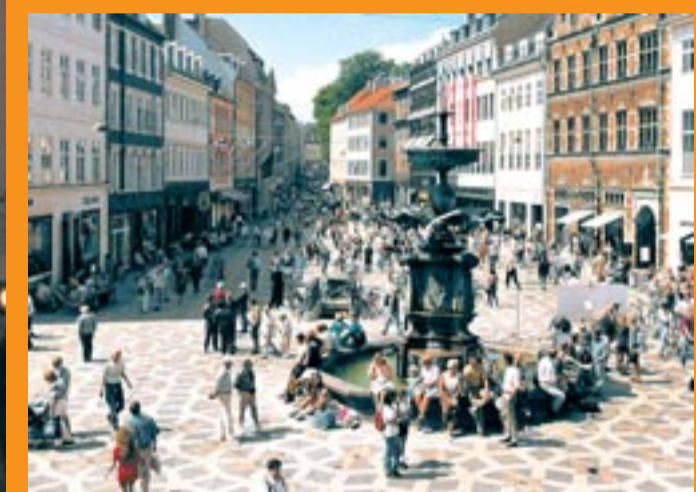
De Storkfontein in Strøget, de winkelstraat in Kopenhagen.