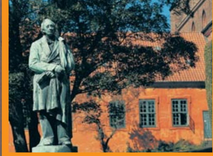
Het standbeeld van Hans Christian Andersen in Odense, waar hij tweehonderd jaar geleden werd geboren.