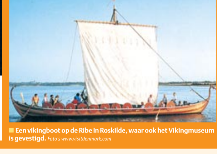
Een vikingboot op de Ribe in Roskilde, waar ook het Vikingmuseum is gevestigd.