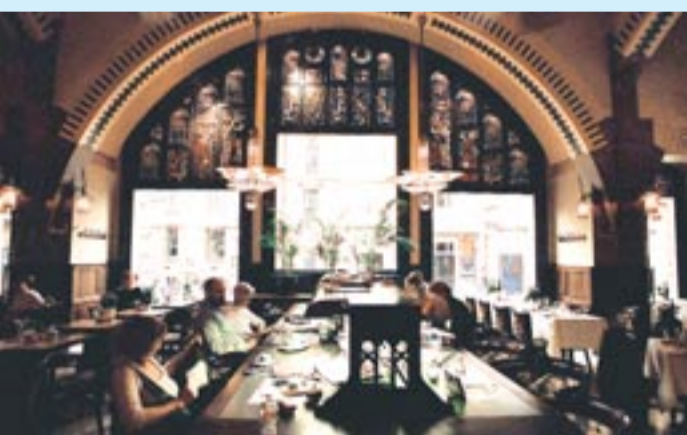
Meubelen, ramen en luchters in art nouveau, en arabesken in Moorse stijl kleuren het Café Americain, deel van het hotel.

vaste herkenningspunten van de stad. Vandaag zijn er 174 luxekamers in art deco-stijl. Veel toeristen én Amsterdamers houden ervan. Ook kunstenaars beschouwen het als een vaste ontmoetingsplaats. Zo verbleef Simon Carmiggelt er regelmatig in 'zijn kamer' om er te schrijven, hoewel hij vlakbij woonde. Het hotel is ook een geklasseerd gebouw. Jammer genoeg kreeg de toegang in de jaren zeventig een moderne look, waardoor het art nouveau-uitzicht verloren ging. Het beroemde Café Americain, dat deel uitmaakt van het hotel, is gewoonweg prachtig met meubelen, ramen en luchters in art nouveau, Moors aandoende arabesken en olieverfschilderijen met tafereel uit Shakespeare's toneelstuk 'A Midsummer Night's Dream'.