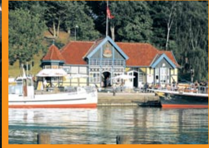
Silkeborg en zijn tintelende meren.